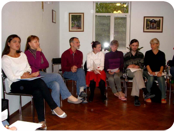
Встреча-размышление киевской общины

Подготовлено под руководством Международного Центра Обучения для института Советников. Приведённые выдержки из отчётов могли быть отредактированы в отношении грамматики, ясности или объёма текста. Весь документ или его части могут воспроизводиться или распространяться в пределах общины бахаи без специального разрешения Центра Обучения.