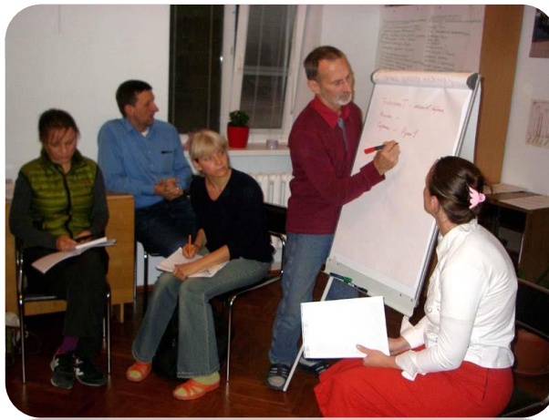
Встреча-размышление киевской общины

Читать информацию на официальном сайте Общины Бахаи города Киева, Украина.