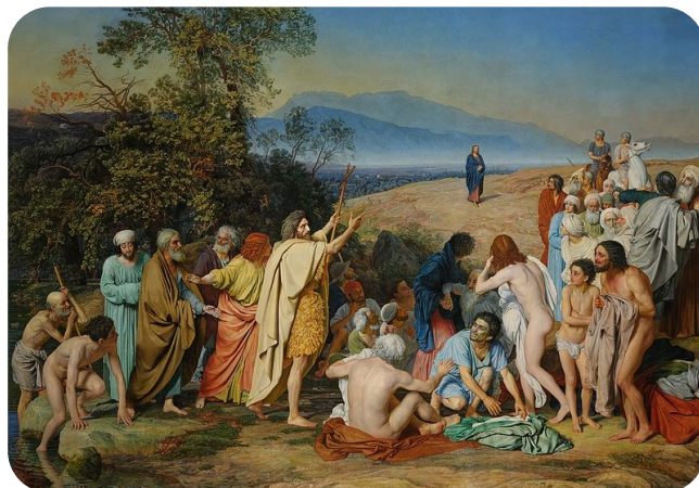
«Явление Христа народу», Александр Иванов, 1837-1857

Иоанн Креститель объявил о приходе Иисуса, подобно тому, как Баб объявил о приходе Бахауллы,— хотя, конечно, это были разные исторические эпохи и существуют различия в положении этих святых душ.